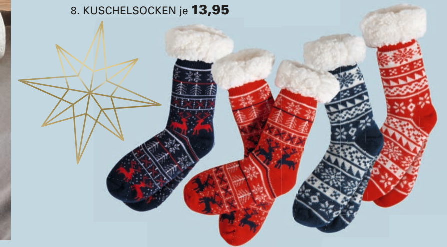
8. KUSCHELSOCKEN je 13,95

5. HERREN-PYJAMAHOSE: Eine Wohltat fürs Auge, angenehm auf der Haut und – kombiniert mit einem bequemen Oberteil – das Wohlfühl-Outfit für die Nacht. Jersey-Qualität in vier unterschiedlichen Dessins. Aus 100 % Baumwolle. Größen: M bis XXL je 19,95. 6. KUNSTFELL-DECKE: Die kuscheligste Versuchung, seit es Decken gibt. Superflauschig und außergewöhnlich voluminös. Durch die markante Hoch-Tief-Struktur ein echter Eyecatcher, der Sofaabende zum Wohlfühlerlebnis macht. Rückseite mit weicher Microfaser. Aus 100 % Polyester. 150 / 200 cm 129,-. 7. NACKENSTÜTZKISSEN DORMABELL CERVICAL: Softiges, zweiteiliges Latexkissen zur perfekten Druckverteilung. Mit atmungsaktivem Bezugsstoff, durch Reißverschluss abnehmbar und bei 60 °C waschbar. Preisbeispiel: NB 4 139,95. 8. KUSCHELSOCKEN: Hübsch gemustert und wunderbar wärmend. Die wohltuende Alternative zu kalten Füßen. Mit Anti-Rutsch-Noppen. Aus 100 % Polyester. One Size je 13,95.