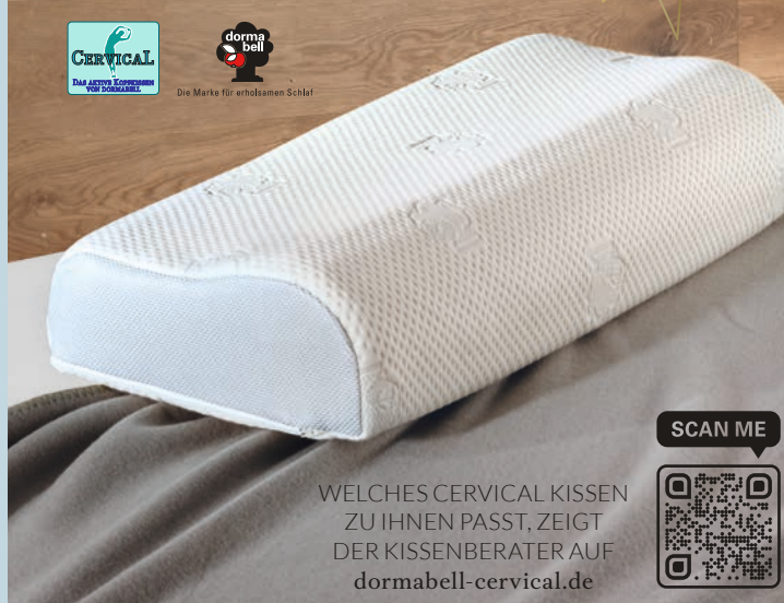
7. NACKENSTÜTZKISSEN DORMABELL CERVICAL Preisbeispiel: NB 4 139,95

WELCHES CERVICAL KISSEN ZU IHNEN PASST, ZEIGT DER KISSENBERATER AUF dormabell-cervical.de