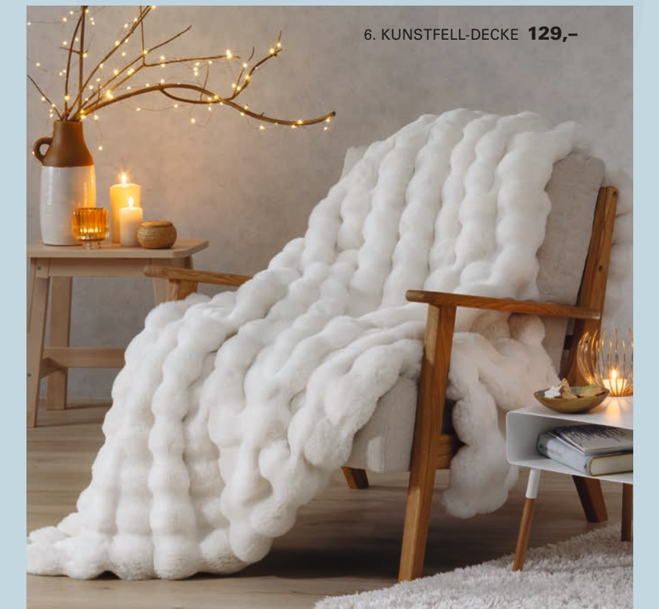
6. KUNSTFELL-DECKE 129,-