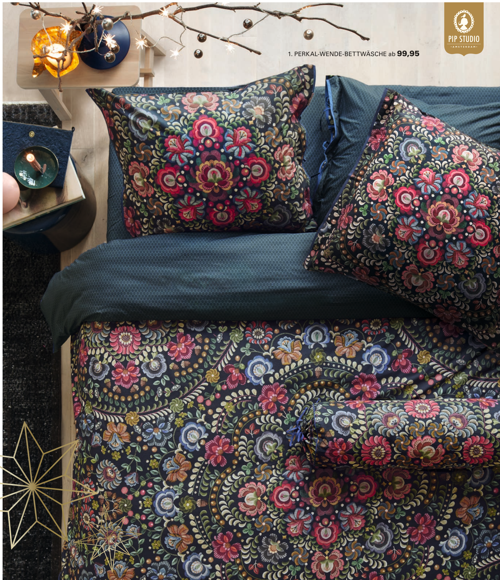
1. PERKAL-WENDE-BETTWÄSCHE ab 99,95