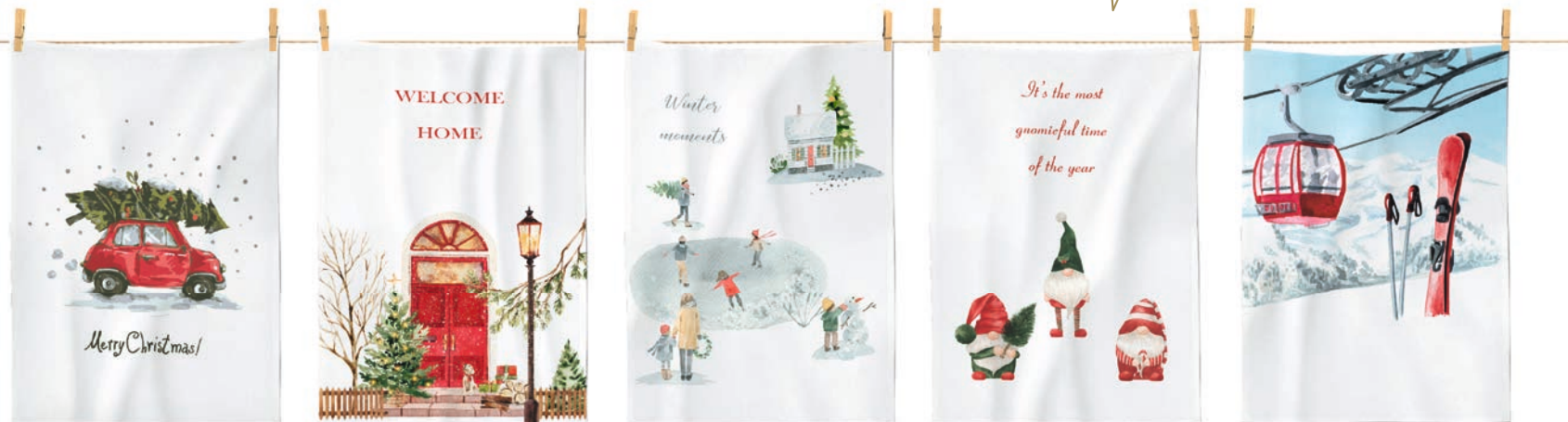
3. GESCHIRRTÜCHER je 6,95

1. BIBER-BETTWÄSCHE: Angenehm wärmend, weich zur Haut und außergewöhnlich im Dessin. Passend zur Jahreszeit bedruckt mit verspielten winterlichen Motiven. Aus 100 % Baumwolle. Mit Reißverschluss. 135 / 200 cm 49,95, 155 / 220 cm 59,95. 2. FLANELL-BETTWÄSCHE: Gemütlicher geht's nicht. Hübsches Karomuster in warmen Farben und kuschelweicher Flanellqualität bringt Entspannung und Wohlfühlatmosphäre ins Bett. Aus 100 % Baumwolle. Mit Reißverschluss. 135 / 200 cm 69,95, 155 / 220 cm 89,95. 3. GESCHIRRTÜCHER: Vielseitige Küchenhelfer, die optische Akzente setzen. Schön praktisch und saugfähig in fünf süßen, vom Winter inspirierten Dessins. Aus 100 % Baumwolle. 50 / 70 cm je 6,95. 4. DAMEN-PYJAMA: Bequeme Begleitung für kühle Nächte und fast zu schön, um nur darin zu schlafen. Geschmeidige, atmungsaktive Jersey-Qualität in vier bezaubernden Varianten. Aus 100 % Baumwolle. Größen: S bis XL je 29,95.