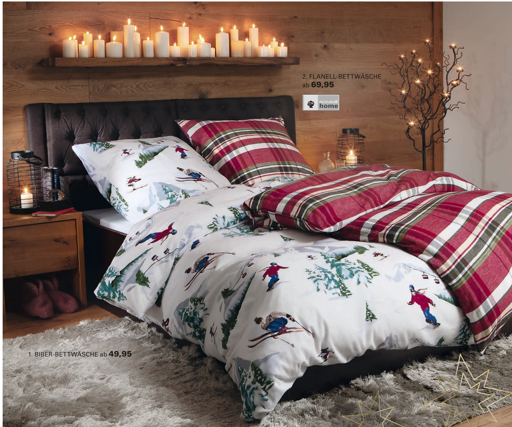
2. FLANELL-BETTWÄSCHE ab 69,95